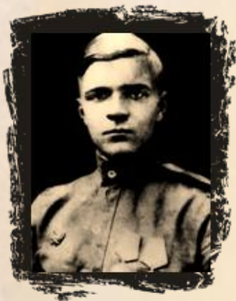
Бондарев Юрий Васильевич (1924-2020)

У Бондарева две боевые награды – медали «За отвагу»: в августе 1943 года в Сумской области, будучи командиром орудия, уничтожил три огневых точки, одну автомашину, одну противотанковую пушку и 20 солдат и офицеров противника, в марте 1944 года в Каменец-Подольске сумел отразить танковую контратаку. Воевал под Сталинградом, дважды получал тяжелые ранения и после госпиталя возвращался на фронт.