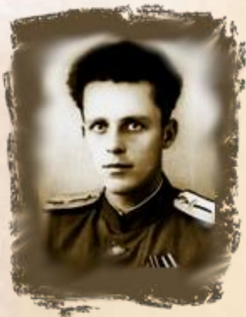
Васильев Борис Львович (1924-2013)

В 17 лет Борис идет добровольцем на фронт вместе с истребительным комсомольским батальоном. Батальон получил приказ направиться под Смоленск, где и очутился в окружении, выйти из которого удалось только в октябре 41-го года. После выхода из окружения Борис оказывается в лагере для перемещенных. Он сам пожелал стать курсантом кавалерийской, а потом пулеметной полковой школы. Дальнейшее место службы – 8-ой гвардейский воздушно-десантный полк. 16 марта 1943 года под Вязьмой состоялась высадка воздушного десанта, где Васильев получил тяжелую контузию на