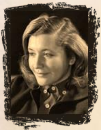
Друнина Юлия Владимировна (1924-1991)

Приписав себе лишний год, Юлия Друнина в 1941 г. ушла на фронт. Прошла боевой путь от Москвы до белорусского Полесья и Прибалтики. Получила ранения и контузию. Войну закончила старшиной медицинской службы с орденом Красной Звезды и медалью «За отвагу».