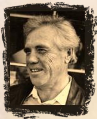
Астафьев Виктор Васильевич (1924-2001)

Президент РФ Владимир Путин подписал указ о праздновании 100-летия со дня рождения писателя Виктора Астафьева.