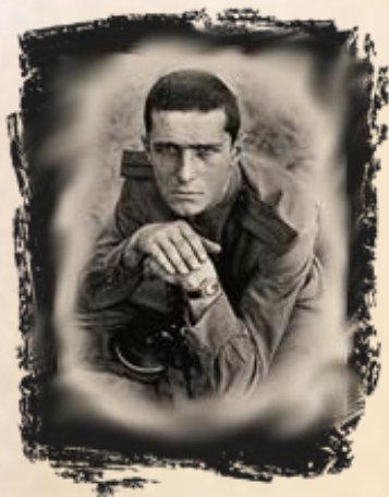
Богомолов Владимир Осипович (1924-2003)

С первых дней войны Владимир записался в добровольцы Московского противопожарного полка. Позже поступил в полковую школу младших командиров при воздушно-десантной бригаде. Командовал отделением разведки при воздушно-десантной бригаде, получил тяжелое ранение. В 1943 г. стал курсантом Ленинградского Краснознаменного артиллерийско-технического училища. Попал в военную разведку, участвовал в форсировании Днепра и в наступательной операции под Кировоградом, получил ранение, снова оказался в госпитале.