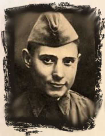
Старшинов Николай Константинович (1924-1998)

В 1941 году Николай был призван в армию и зачислен в пехотное училище. Окончить его курсанты не успели. Их выпустили досрочно в звании сержантов и отправили на фронт. В 1943 г. в бою под Спас-Деменском старший сержант Николай Старшинов осколками разорвавшейся мины был тяжело ранен. В госпиталях он пробыл почти год. Врачи не стали ему ампутировать ноги, но осколки в ногах остались, и он всю оставшуюся ходил с клюшкой. Н. Старшинов был награждён: