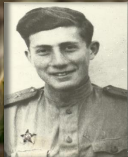
Бакланов Григорий Яковлевич (1923-2009)

В составе 387-го гаубичного полка, в котором он оказался самым молодым бойцом, 18-летний Григорий (настоящая фамилия Фридман) был направлен на Северо-Западный фронт и пробыл там до конца 1942 года. Для пехотинца продержаться так долго было большой удачей. В августе 1943 г., после ускоренного восьмимесячного курса обучения, его вместе с другими выпускниками училищ вернули на фронт. В бою под Запорожьем был контужен и тяжело ранен, полгода провел в госпитале. После выздоровления его признали ограниченно годным к военной службе, но ему удалось вернуться на фронт. Впереди были тяжелейшие бои за Украину, освобождение Венгрии и Австрии.