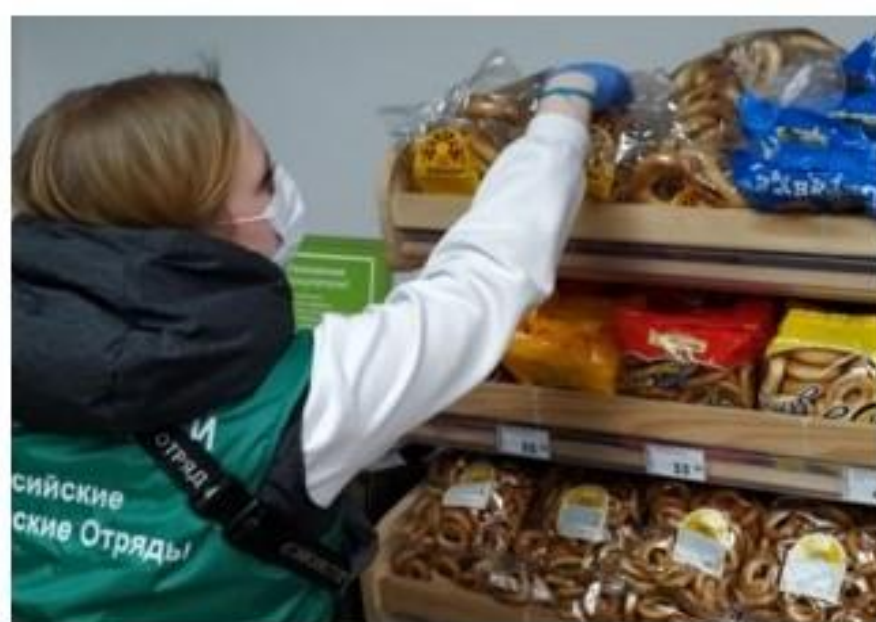
Штаб студенческих отрядов Пермского ГАТУ