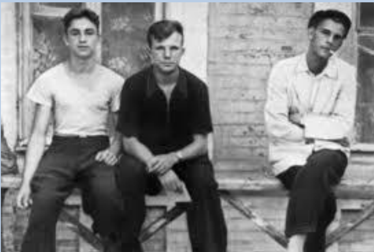
16-летний Юрий Гагарин во время учебы на литейщика в Люберцах. 1950 год.